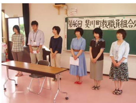
今年度の役員のみなさん